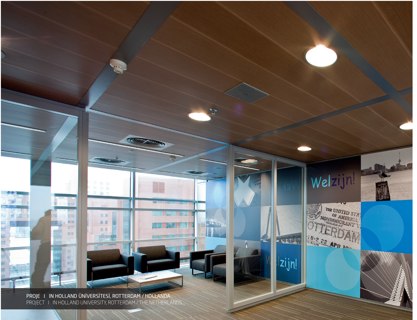
PROJE | IN HOLLAND ÜNİVERSİTESİ, ROTTERDAM / HOLLANDA PROJECT | IN HOLLAND UNIVERSITY, ROTTERDAM / THE NETHERLANDS

Diğer hammadde seçenekleri için lütfen "Satış Departmanına" başvurunuz. For other raw material options please contact "Sales Department".