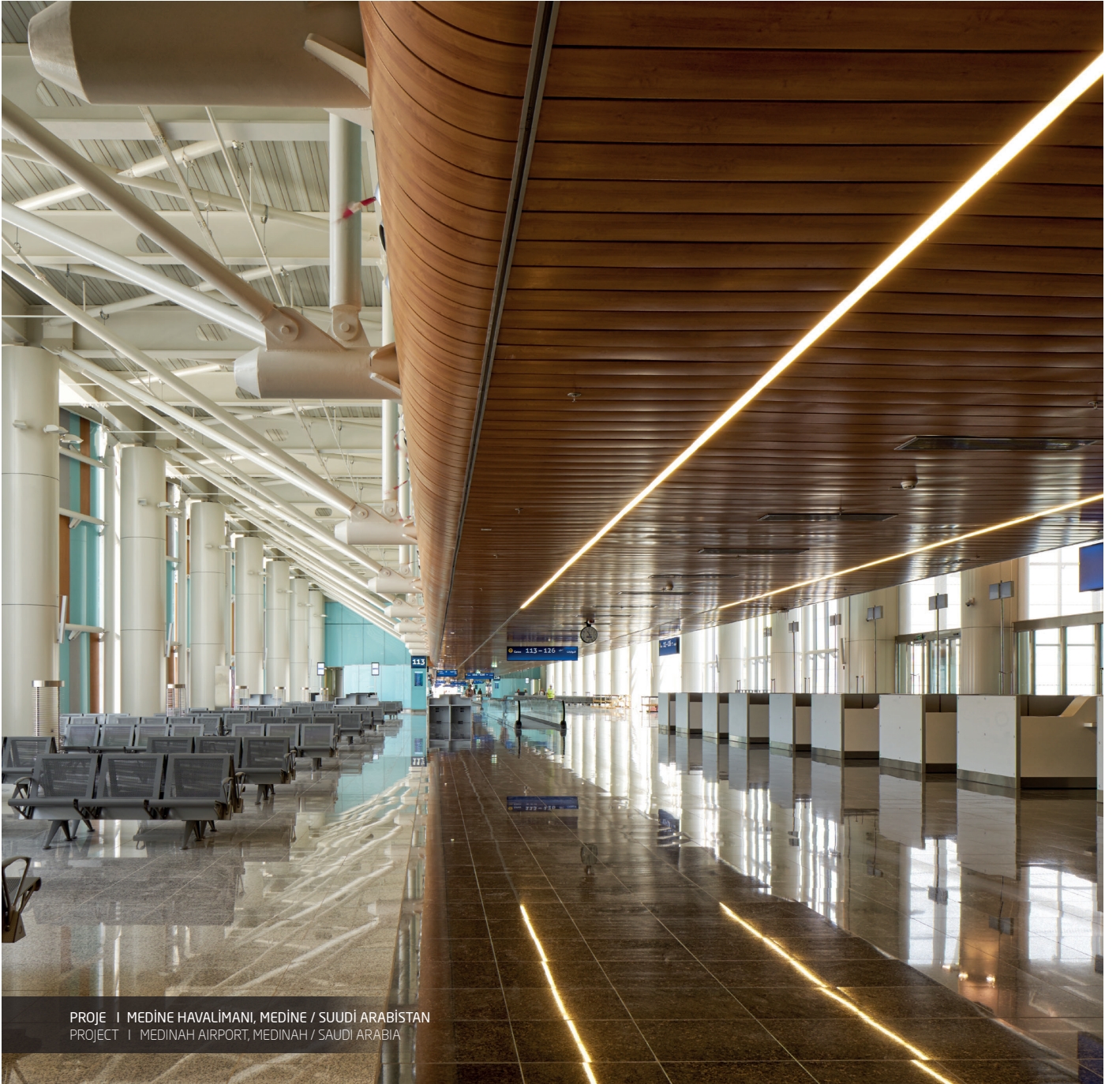
PROJE | MEDİNE HAVALİMANI, MEDİNE / SUUDİ ARABİSTAN PROJECT | MEDINAH AIRPORT, MEDINAH / SAUDI ARABIA

Diğer hammadde seçenekleri için lütfen "Satış Departmanına" başvurunuz. For other raw material options please contact "Sales Department".